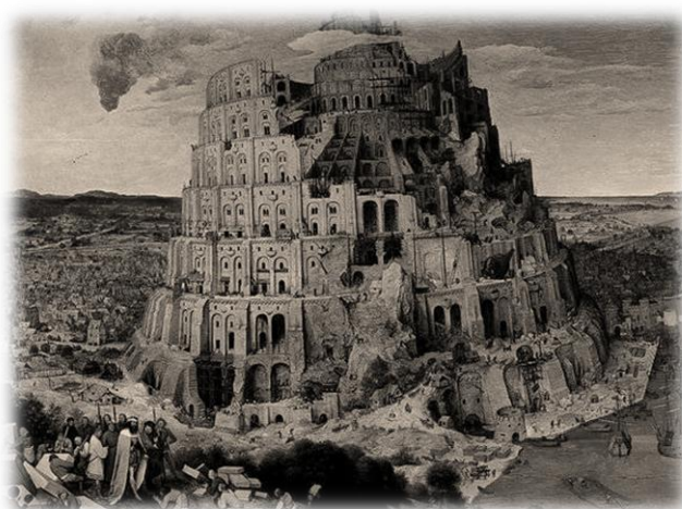
Babylonská veža