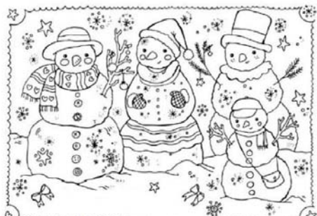
Nájdí 15 rozdielov